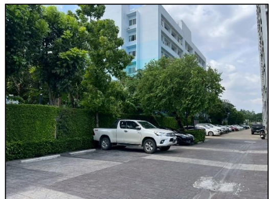
ภาพที่ 1.2-2 สภาพโครงการปัจจุบัน